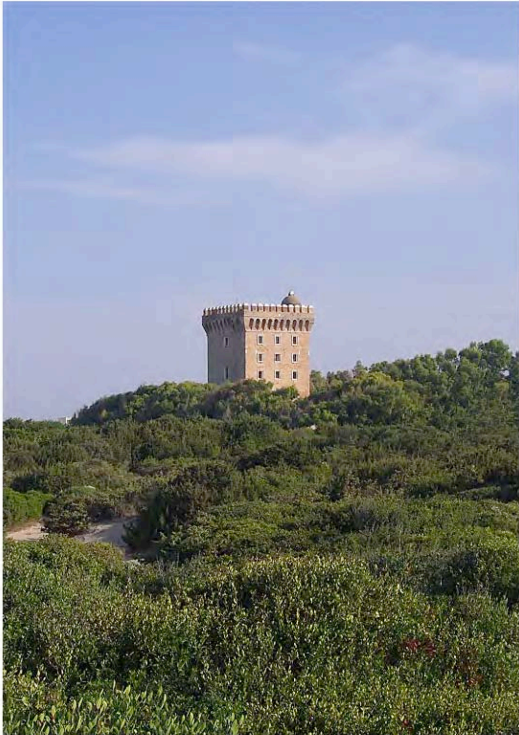
Torre S. Lorenzo