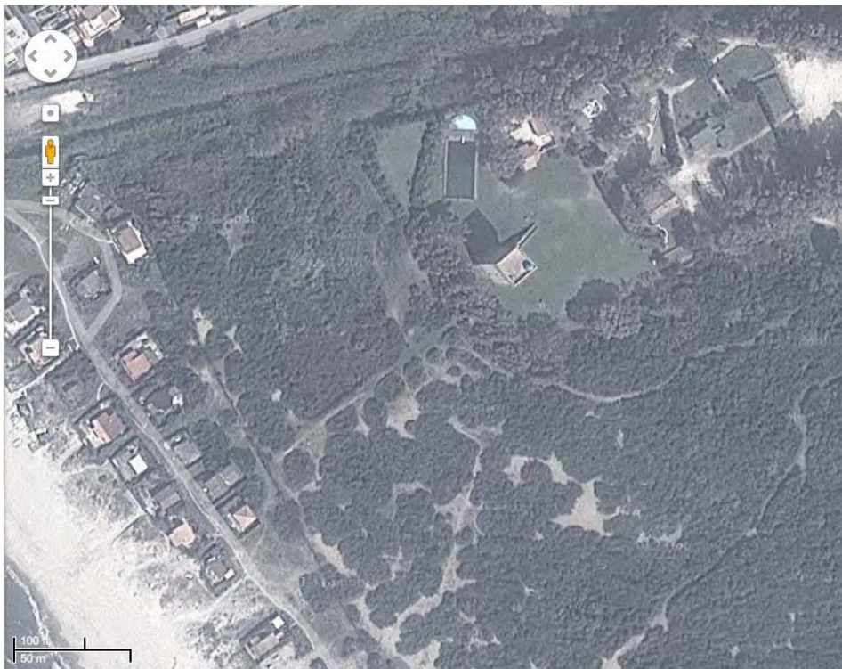
La torre vista dal satellite