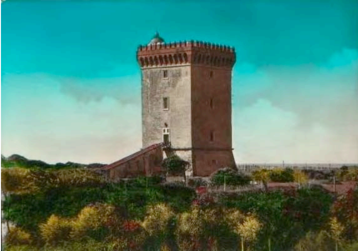
Ardea – Torre di S. Lorenzo, supposta architettura di Michelangelo (da internet)